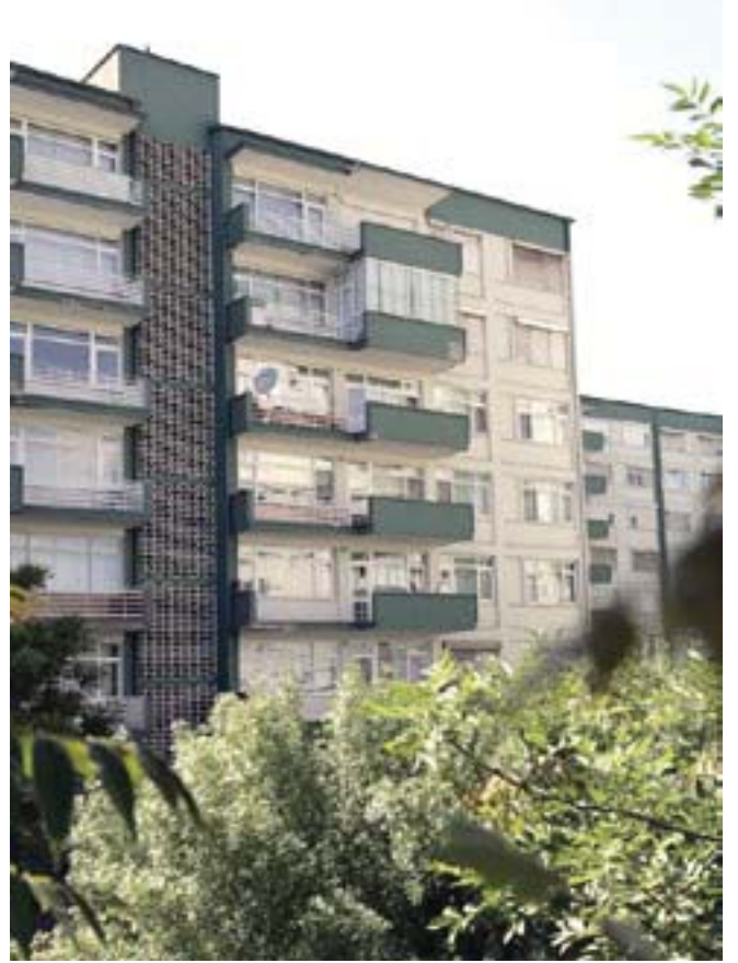
Prizmatik Sirkülasyon Çekirdeği