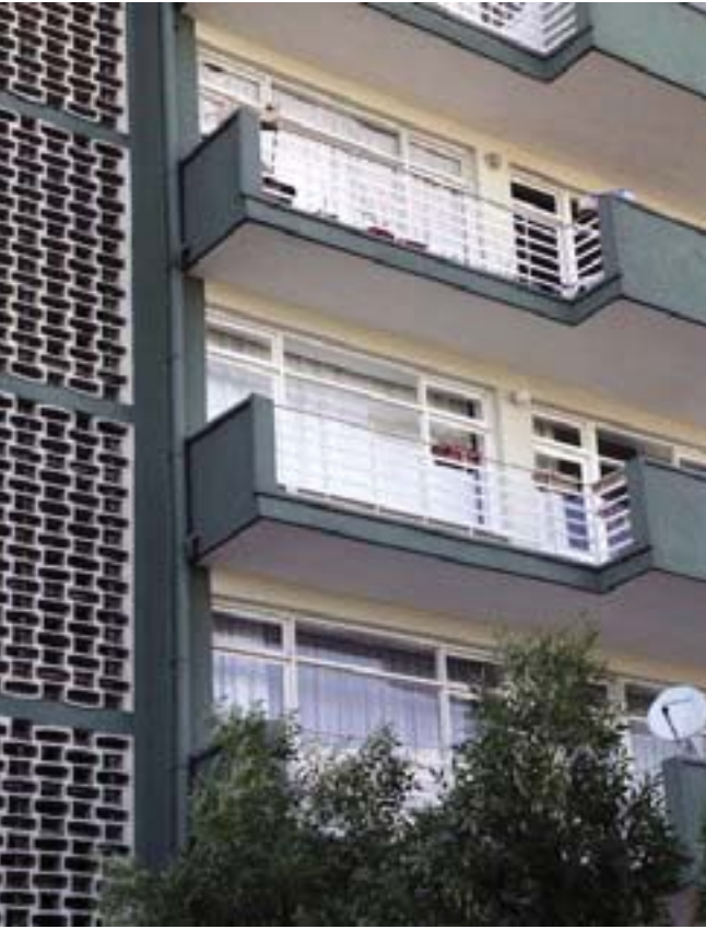
Eti Blokları Balkon Parapetleri