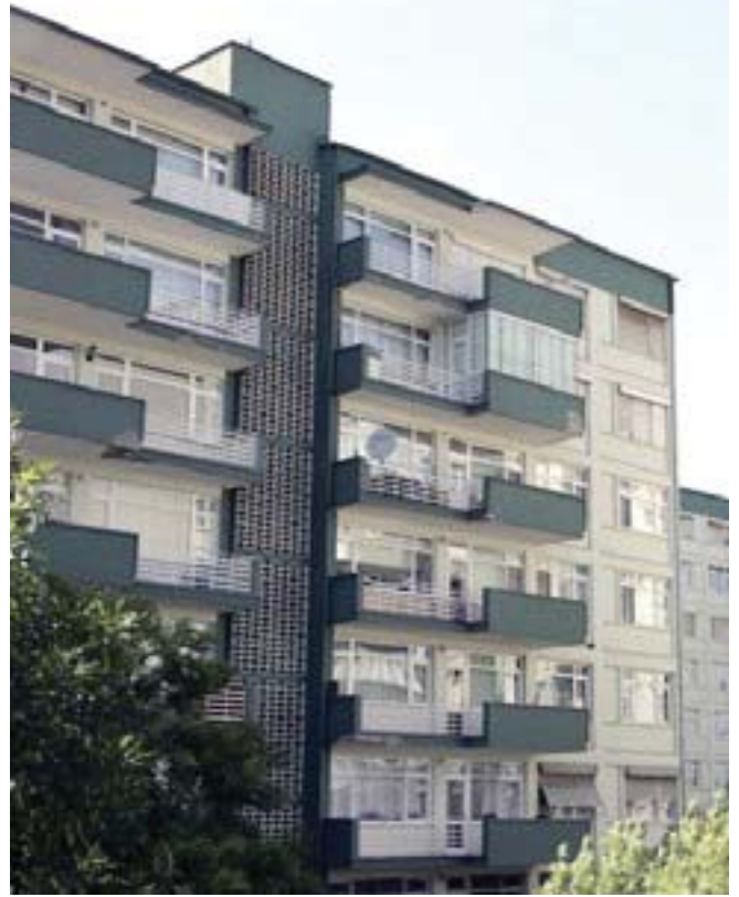
Eti Blokları Genel Görünüşü