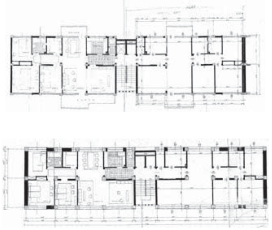
Eti Blokları Konut Plan Şemaları

Konut yapılarının plan şemasında bir ana koridor vardır ve tüm mekânlar bu koridorla ilişkilendirilmektedir. Ana koridor girişte antre işlevindedir. Mutfak, WC, ve salon ilişkisi bu antreden sağlanmaktadır. Antrenin devamında oluşan koridor ise yemek odası ve yine salonu bağlamakta, sandık odası, banyo ve üç yatak odası yine ana koridorun devamında özelleşmektedir. Plan şeması genel kullanımdan, özel kullanıma geçişi öngörmekte, konutların dış ile ilişkisi iki cephede yer alan eşit olmayan büyüklükte iki balkon ile sağlanmaktadır. Yemek bölümüne açılan ve arka cephede yer alan balkon bağımsızdır. Salona açılan ve ön cephede yer alan balkon ise cephenin bir elemanı olarak ele alınmıştır. Kooperatif üyeleri arasında eşitlikçi bir yaklaşımla aynı plan şeması uygulanarak blokların yan cepheleri sağır bırakılmıştır.