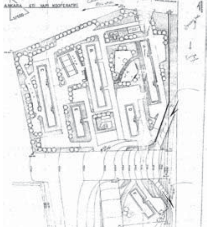
Eti Blokları Yerleşimi Vaziyet Planı

Eti Blokları yerleşiminde yer alan konut yapıları aynı plan şemasına sahip, ön ve arka cepheli, oldukça büyük dairelerden oluşmaktadır. Bloklarda her katta iki daire yer almaktadır. Giriş, zeminden yükseltilmiş olduğu için bodrum kat tam kat olarak algılanmakta, zemin