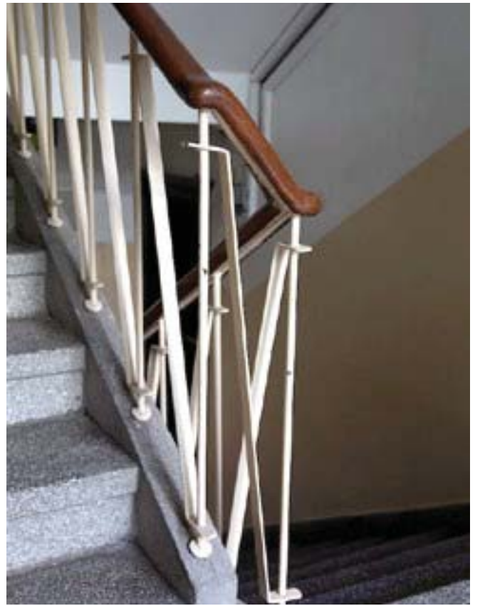
Blok İçi Merdiven Korkulukları