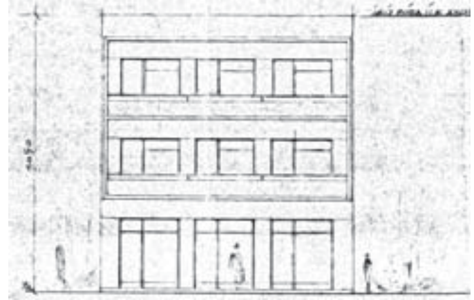
Resim-3 Apartman Projesi Ön Cephe Çizimi

Söz konusu proje daha uygulama aşamasında bir dizi değişikliğe uğramıştır. Yapının giriş katı cephesi taş kaplama bir yüzeye dönüştürülmüş, giriş üzerine oval bir saçak eklenmiş, korkuluklar değiştirilmiş ve dökme demir korkuluklar tercih edilmiş, zemin katta yer alan dükkanlar projeden çıkartılmış ve yapıya bir daire daha eklenmiştir. Yapının ruhsatında Mamak Belediyesi arşivlerinde bulunan projenin tasdik tarihi olan 14 Mart 1956 tarihi yerine 20 Mart 1956 tarihi yer almaktadır. Bu da projenin bu kısa zaman dilimi içerisinde tekrar ele alınarak, yeniden çizildiğini göstermektedir. Ancak kısa zamanda üretilen bu ikinci projeye arşivlerde rastlanamamıştır.