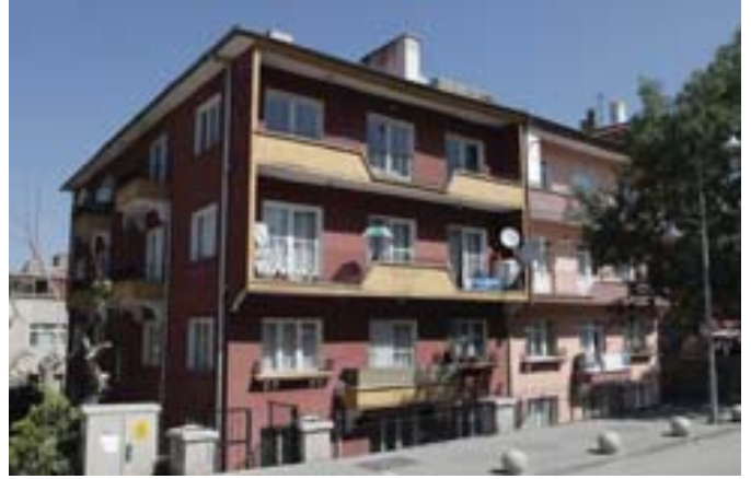
Resim-1 Demirlibahçe'de Nejat Ersin'in Tasarladığı Apartmanlar

İkiz konut yapısının Nejat Ersin tarafından, Türkiye'de savaş sonrası üretilen modern mimarlık anlayışının bir uzantısı olarak tasarlandığı söylenebilir ( Resim 2 ). Oldukça yalın bir biçimde tasarlanan yapı ikiz apartmanlardan oluşmaktadır. İki yapı da aynı proje ile inşa edilmiştir. Nejat Ersin 1950