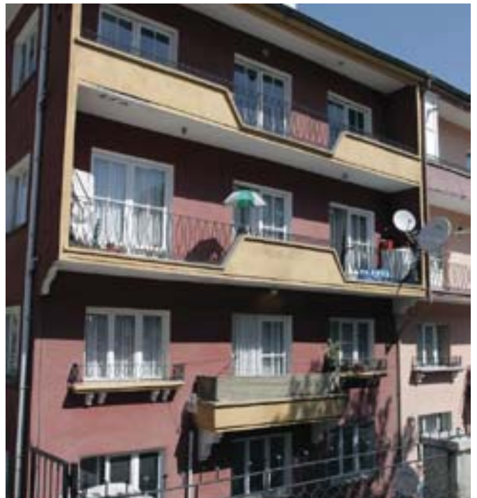
Resim-2 Apartman Bloğunun Ön Cephesi