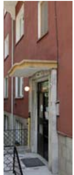
Resim-6 Apartman Bloğunun Girişi