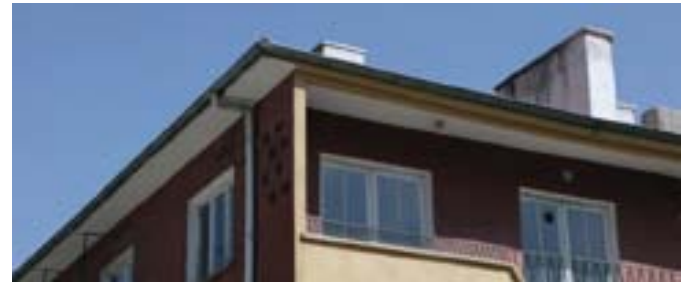
Resim-4 Apartman Bloğundan Detay