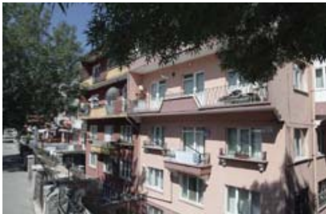
Resim-8 Apartman Bloğunun Bir Diğer Görünüşü

nedeninin mal sahibinin yapının inşa edildiği bölgedeki diğer yapılara benzer uygulama talep etmiş olduğu düşülebilir. Zira, bu dönemde bölgede inşa edilmiş olan apartman projeleri 1940'lı yılların mimarlık anlayışına göre inşa edilmiş, geniş saçakları, simetrik cepheleri, cephede giriş katlarında kullanılan kesme taşları, dökme demirden korkulukları ve yığma tuğla sistemleri ile geçmişe referansla tasarlanmış ya da doğrudan uygulanmış yapılarıdır.