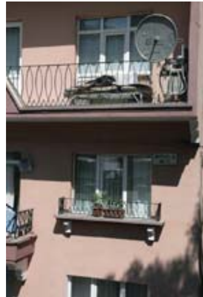
Resim-5 Bloğun Yan Cephe Pencere Düzenine Örnek